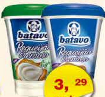
REQUEIJÃO BATAVO LIGHT/TRAD 200G