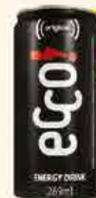
ENERGÉTICO ECCO LATA 269ml