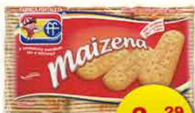
BISCOITO MAIZENA FORTALEZA 400g