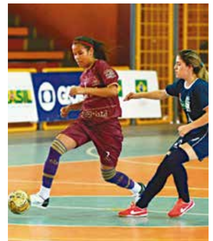
Competição terá 4 mil atletas

LUTO PÁGINA 22 Morre Potengi Lucena, ex-presidente da Federação Paraibana de Vôlei