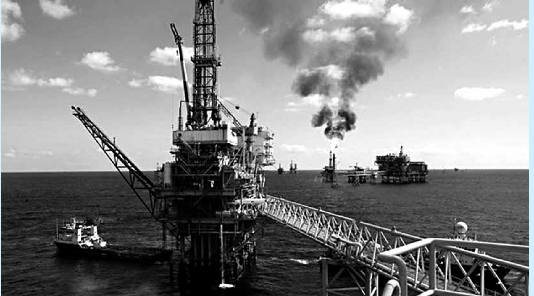
Dados da Agência Nacional do Petróleo revelaram que foram produzidos 2,36 milhões de barris de óleo por dia em setembro, volume 1,4% superior a agosto