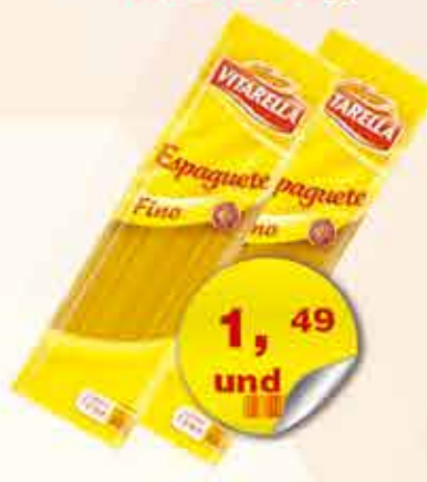
MACARRÃO ESPAGUETE BISCOITO CREAM CRACKER VITARELLA COMUM 500g