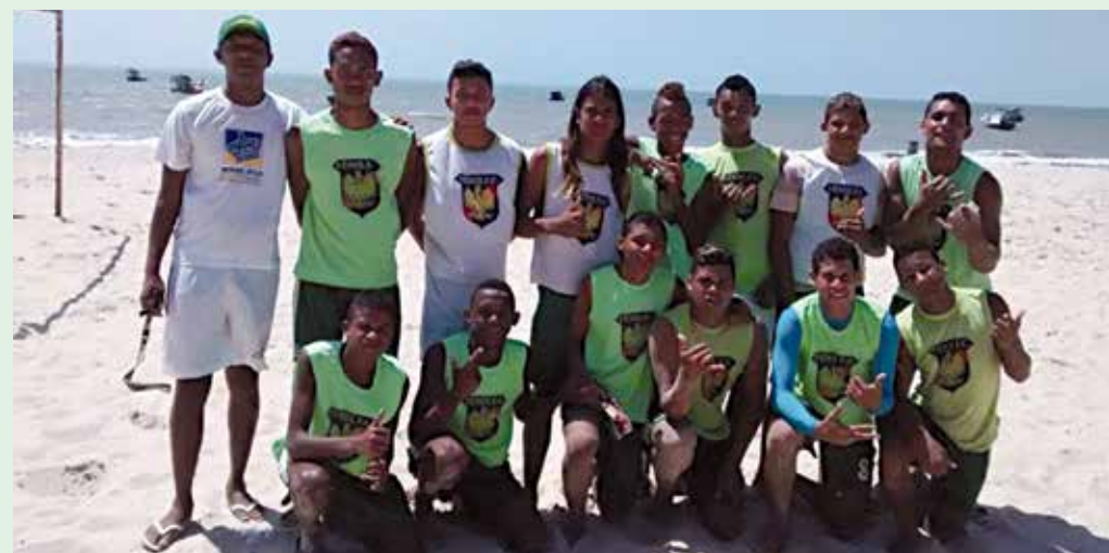
O Colégio e Curso Menino Jesus estará em Natal-RN, representando o Estado em evento