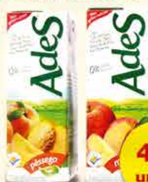
BEBIDA DE SOJA ADES 1LT SABORES