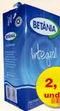
LEITE BETÂNIA UHT 1L INT/DES/SEMI