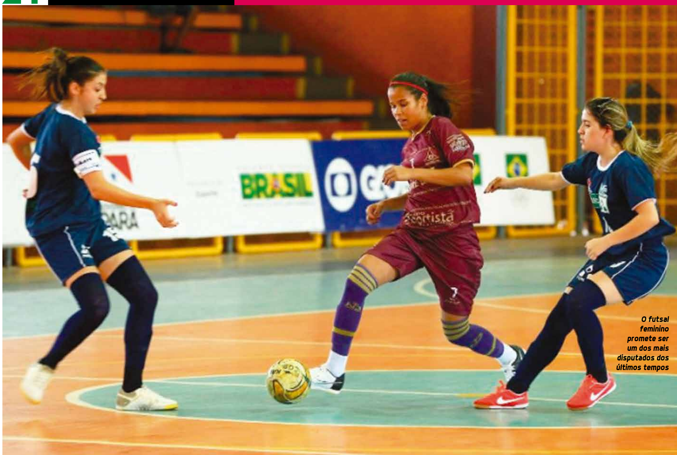
O futsal feminino promete ser um dos mais disputados dos últimos tempos