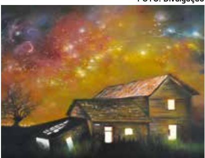
Pintor inspira-se na própria infância