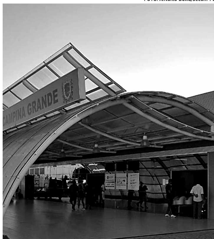
Unidade é referência em traumatologia para 203 municípios

O Trauma-CG é referência em traumatologia para 203 municípios da Paraíba, além de algumas cidades do Rio Grande do Norte e Pernambuco. O Governo do Estado investe mensalmente cerca de R$ 8 milhões para a manutenção do hospital.