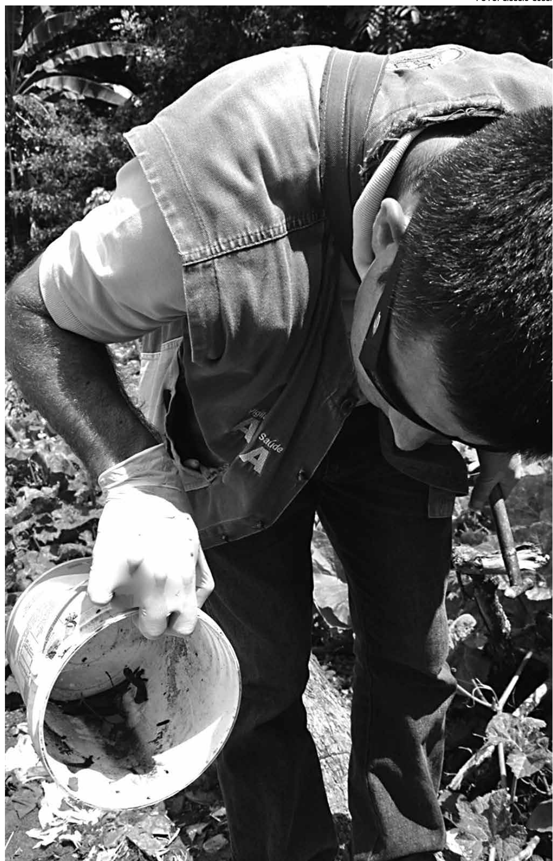
A diminuição de casos de dengue pode estar associada às ações realizadas pela SES em 2013 e 2014

Estima-se que esta edição terá participação de três mil voluntários. A expectativa é de que mais de 50 mil pessoas sejam beneficiadas. Para ser voluntário, é só se inscrever no site do projeto, www.cidadeviva.org/godstock