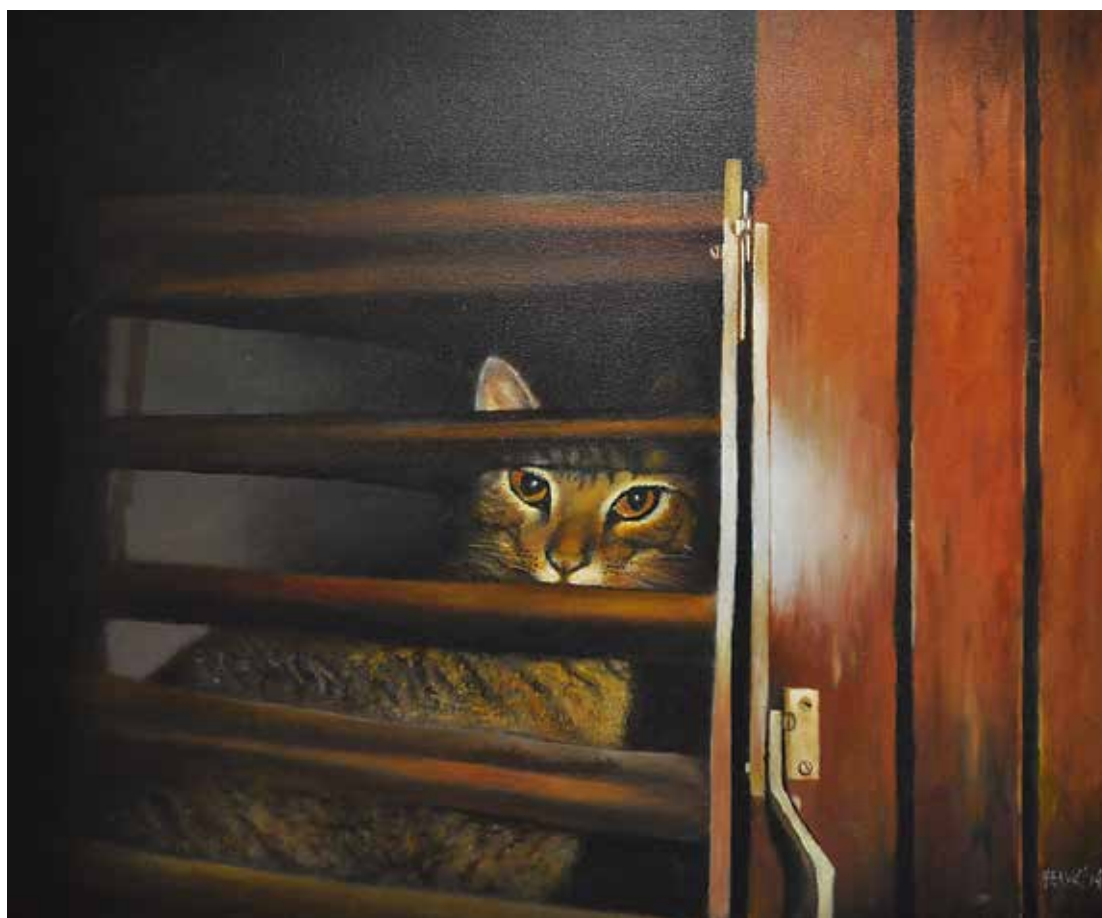
Um dos trabalhos de Herval Mendes que está em cartaz na exposição da Energisa

O artista se inspira no seu universo poético, desde a sua infância, nas ladeiras de Olinda, até as vivências mais recentes. As telas expostas fazem parte de uma produção dos últimos dois anos e mostram, além das marinhas, cenas aparentemente banais, como um gato olhando pela fresta de uma jane-