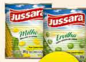
ERVILHA OU MILHO VERDE JUSSARA LT 200g