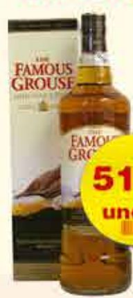
WHISKY FAMOUS GROUSE 1LT