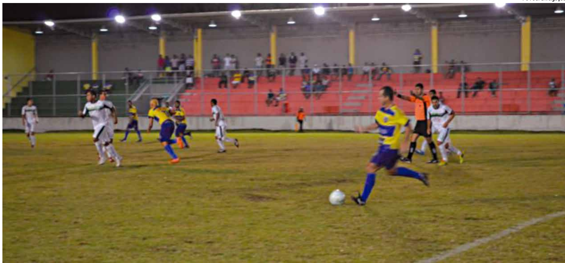
Nesta competição, as duas equipes já se enfrentaram duas vezes, com vitória do Miramar e um empate, deixando partida de hoje com muito mais rivalidade