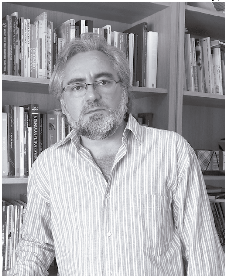
Expedito Ferraz dividiu a obra em quatro partes

A poesia de Expedito Ferraz vai do minimalismo dos haicais aos versos livres, passando pela construção dos ritmos irregulares e pelos poemas visualmente expressivos. A obra abarca uma variedade de temas que exploram as virtualidades da linguagem poética. Em reunião do Correio das Ar-