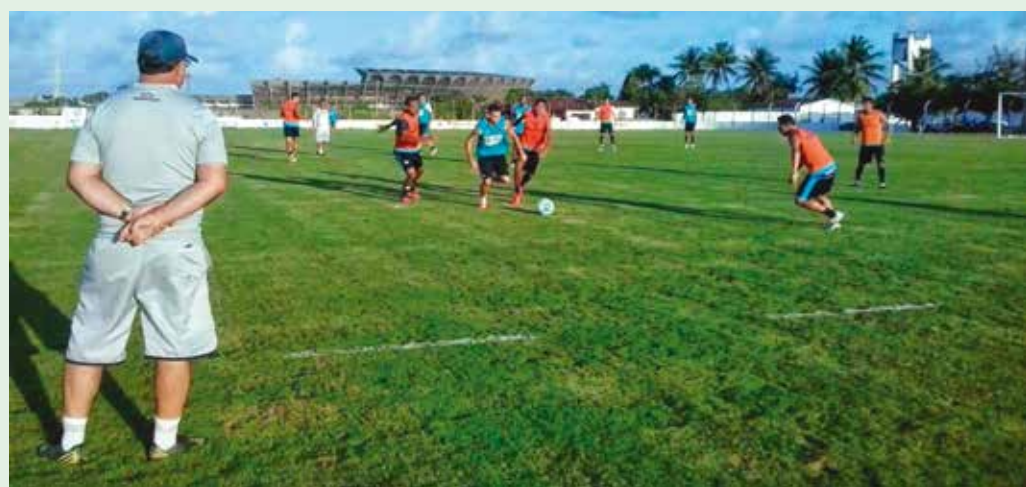
Este ano, o treinador conseguiu dar muito mais visibilidade ao Botafogo em âmbito nacional