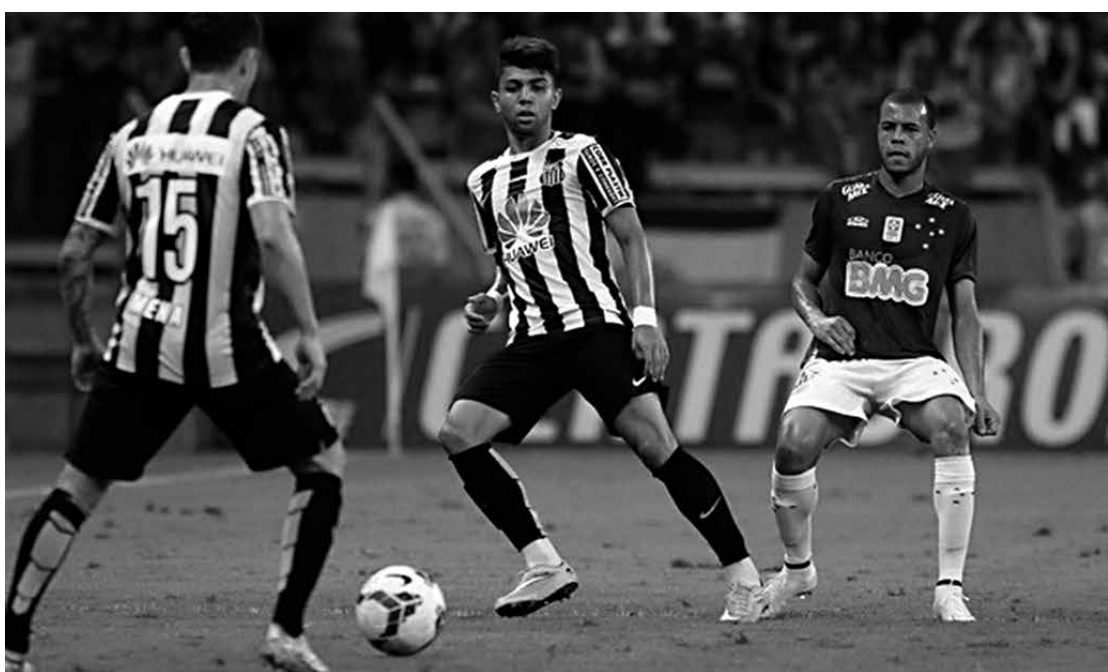
O Santos promete pressionar e não dar trégua ao Cruzeiro no jogo de volta pela Copa do Brasil