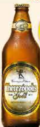
CERVEJA THEREZÓPOLIS GOLD 355ml