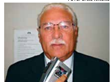
Popó estava internado há 15 dias