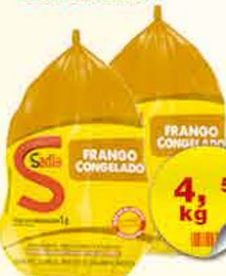
FRANGO INTEIRO CONG. SADIA