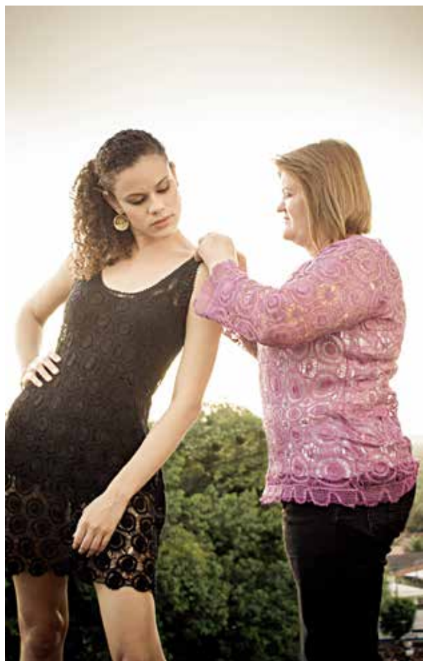
Organizações culturais que se destacam no processo de formação cidadã na Paraíba disputam prêmio nacional

Os objetivos do Circo Escola Piollin são os de promover a reinserção dos participantes do projeto à escola, fortalecer vínculos familiares e encaminhar crianças e jovens a programas socioassistenciais. “Fazer parte dos finalistas do prêmio já nos dá uma