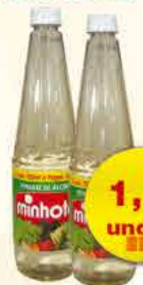
VINAGRE DE ÁLCOOL MINHOTO LEVE 750ml PAGUE 500ml