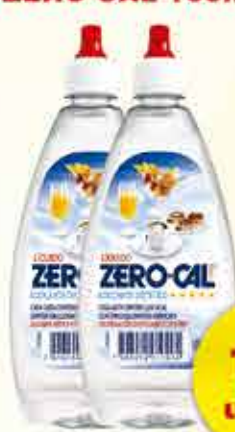
ADOÇANTE LÍQUIDO ZERO CAL 100ml