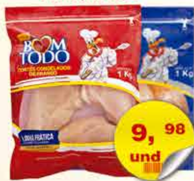
FILE DE PEITO IQF BOM TODO PCT 1Kg TEMP/IN NAT