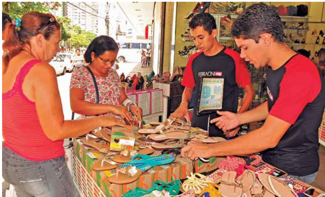
Somente o comércio varejista deverá gerar 5 mil postos de trabalho temporários na Paraíba