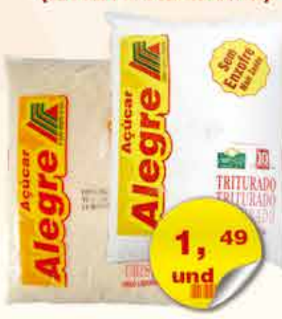
AÇÚCAR ALEGRE 1Kg (EXCETO DEMERARA)