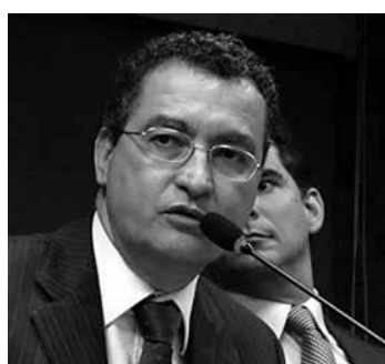
Deputado Rui Costa, do (PT-BA)

Na reunião de ontem, deputados do Conselho definiram a lista tríplice de relatores que ainda serão escolhidos, até o final desta semana, para analisar a situação de Rui Costa, Florence e Pellegrino. Os três nomes que integram o PT baiano são acusados de envolvimento no desvio de R$ 17,9 milhões do Fundo de Combate à Pobreza, desde 2004, destinados à construção de mais de 1,1 mil casas populares para famílias de baixa renda. As representações foram apresentadas pelo PSDB e DEM baseadas em denúncia publicada, em setembro, pela revista Veja.