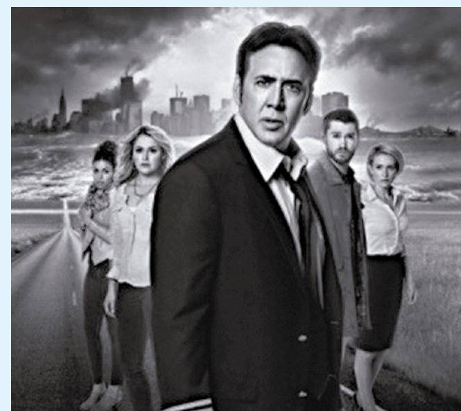
Filme mostra o desaparecimento de pessoas

TIM MAIA (BRA 2014) . Gênero: Drama. Duração: 141 min. Classificação: 16 anos. Direção: Mauro Lima. Com Babu Santana, Robson Nunes e Aline Moraes. Cinebiografia do cantor Tim Maia, baseada no livro "Vale Tudo - O Som e a Fúria de Tim Maia". O filme percorre cinquenta anos na vida do artista, desde a sua infância no Rio de Janeiro até a sua morte, aos 55 anos de idade, incluindo a passagem pelos Estados Unidos, onde o cantor descobre novos estilos musicais e é preso por roubo e posse de drogas. Maneira 4: 15h10, 18h e 21h. Maneira 5: 13h10, 16h, 19h e 22h. CinEspaço 2: 15h, 18h e 21h. Também 5: 14h30, 17h30 e 20h30.