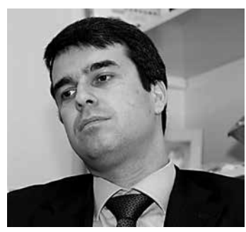
Rodrigo Bethlem, do (PMDB-RJ)