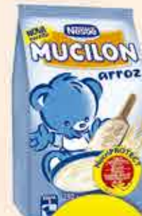
MUCILON SACHET 230g SABORES