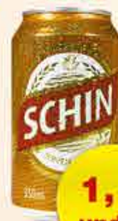
CERVEJA SCHIN LT 350ml