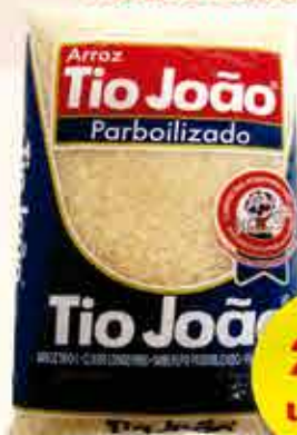
ARROZ TIO JOÃO PARBOILIZADO 1Kg