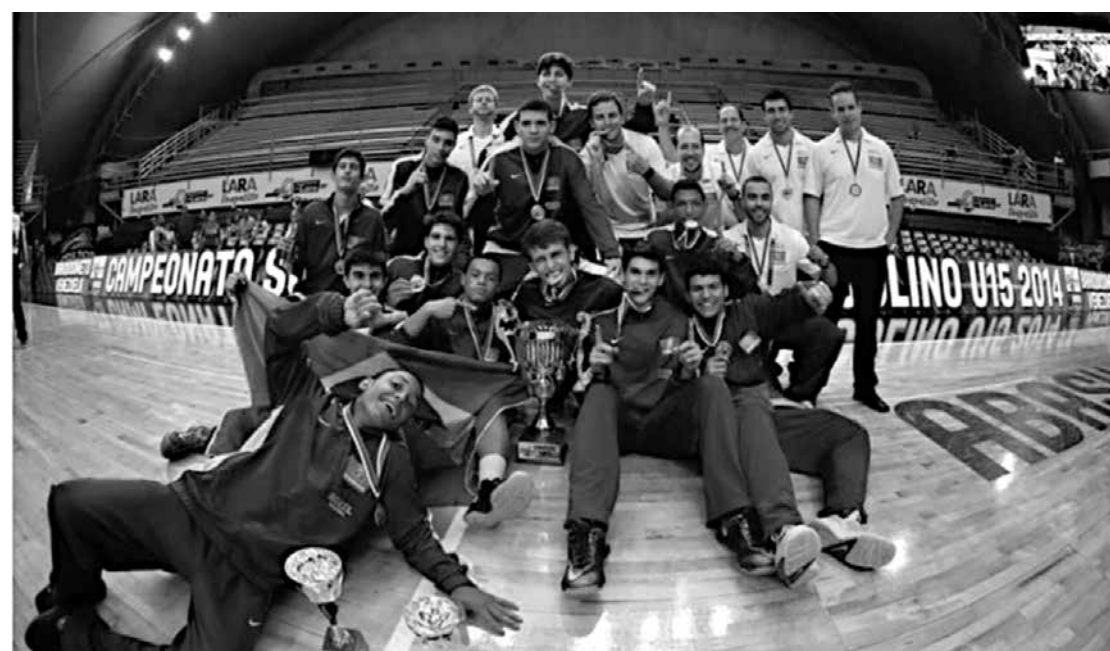
Seleção ficou com a vaga para a Copa América Sub-16, no próximo ano, ao vencer argentinos

Na disputa do terceiro lugar, a Venezuela derrotou o Chile por 68 a 44. As seleções do Brasil (campeão), Argentina (vice) e Venezuela (terceiro) estão classificadas para a Copa América - Pré-Mundial Sub-16 de 2015, que irá garantir aos quatro primeiros colocados a vaga no Campeonato Mundial Sub-17 de 2016.