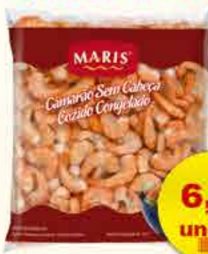
CAMARÃO S/ CABEÇA C/ CASCA MARIS 200g