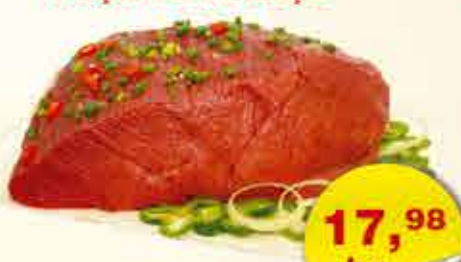
COXÃO MOLE PEÇA OU PEDAÇO